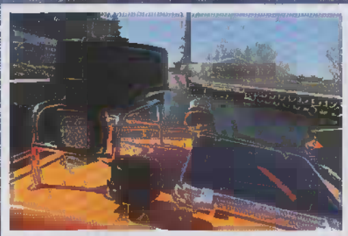
2000-tal möter 1960-tal. Henriks Sjö- mätare möter dagens standard.