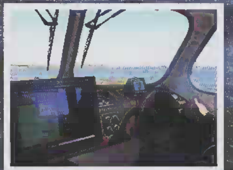
Plotter, radar, instrumentering, reglage och styrning är av senaste snitt.

☞ nom köpa sin numera tokrenoverade Sjö- mätare. Henriks tidigaste minnen sträcker sig i alla fall tillbaka till 1970-talets somrar.