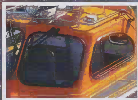
Nog går det att spåra Firally Sjömätare och Cabin till samma källa?