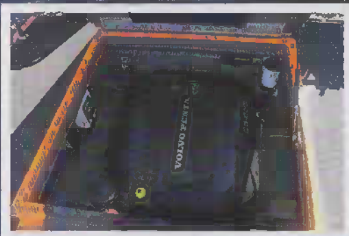
Volvo Penta D3 å 220 hästkrafter ger fartresurser en bit över 40 knop.