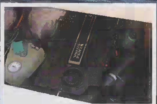
Originalets bensinmotor är ersatt med en Volvo Penta D3 på 160 hästar.