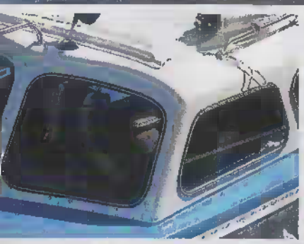
Utsendemässligt ser FrallAnn näst intill ut som hon gjorde 1965.