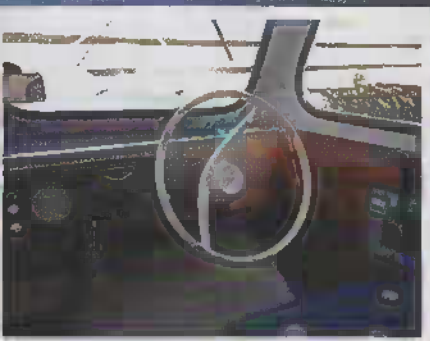
Även invändigt är det mesta i orört originalskick i Hans Firally.