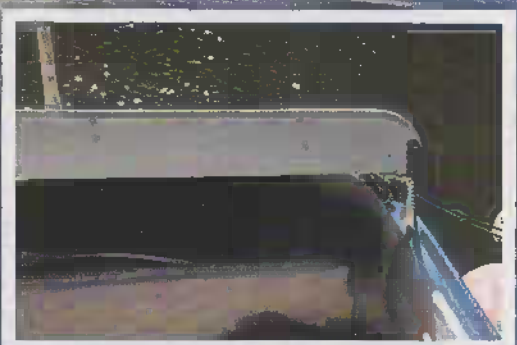
Flisåtra Varv byggde båtar med kapellgarage redan i mitten på 1960-talet.